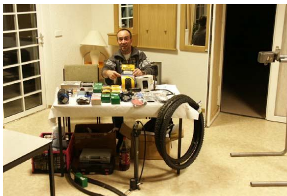
Für Euch vor Ort: „Die Radprofis“ aus Fürstenwalde.

Bei kleineren Defekten an Eurem Bike steht Euch unser Mechaniker mit Rat und Tat zur Seite.