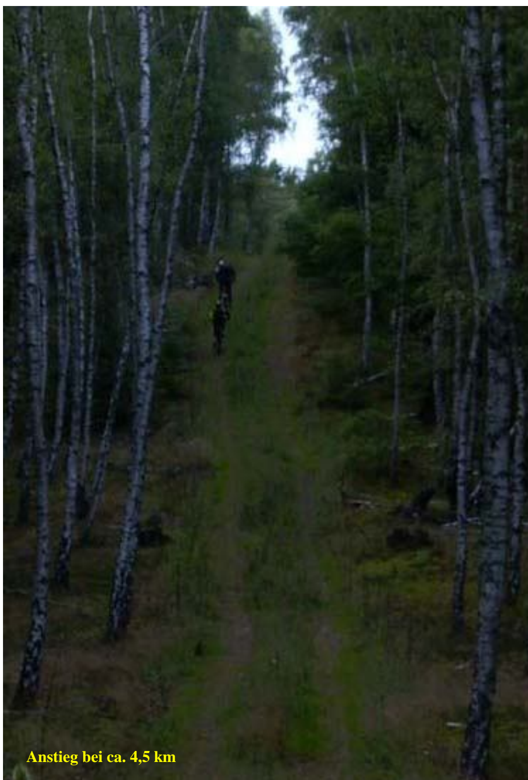
Anstieg bei ca. 4,5 km