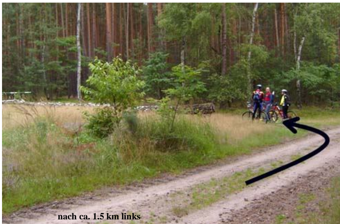
nach ca. 1.5 km links