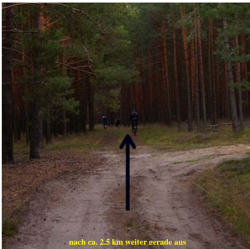
nach ca. 2.5 km weiter gerade aus